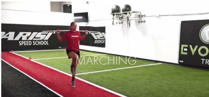
Ilustración 1. Técnica de carreira con pica.

Nesta nova entrega veremos a continuación ao traballo de técnica de carreira. Unha vez detallada a técnica e a súa execución procederemos a realizar os diferentes exercicios e as súas progresións para unha mellora da técnica de carreira.