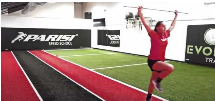
Ilustración 2. Técnica de carreira con pica sobre cabeza.

Na imaxe, tal e como vemos, atopámonos á deportista executando un skipping cunha execución de xeonllos a 90°, realizando unha pisada forte que fai que despegue o pé contrario reactivamente. A execución destes exercicios pedirase con total calidade de execución, gardando a triple extensión , progresando de menos rápido a máis rápido. Un óptimo traballo sería 4x 10 metros.