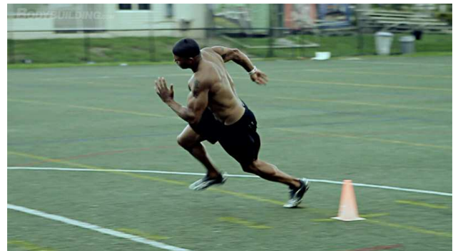
Ilustración 4. Cambios de dirección.

No exercicio que vemos a continuación, procédese a un traballo da triple extensión en posición inclinada, limitada pola carga que fará que traballe a forza e, á vez, a técnica de carreira xunto aos brazos. Ao se tratar dunha cargada elevada, o traballo recomendando será de 2 series de 10 metros cun descanso de 1 minuto entre series.