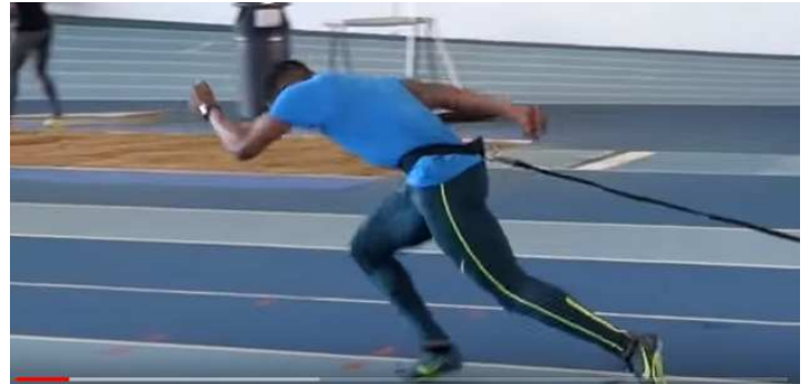
Ilustración 3. Lastres con 80% da carga.

Tal e como nos indica Fran Bosch, preparador físico de diferentes equipos de rugby e preparador físico da velocidade no West Ham United entre outras ocupacións laborais, o traballo ten que ser lento pero seguro e cunha progresión que a atleta poida soportar, pasando da implementación de métodos estables cunha pica a métodos con carga, que supoñan para a deportista un novo estímulo que a faga mellorar.