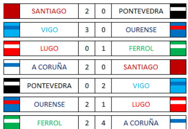
COMARCAL SUB'15 - 1ª FASE O POMBAL PEQUENO (Cambados, 01/01/2017)